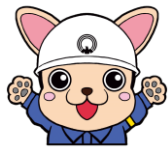
三鷹市防災キャラクターじじよまる