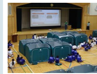
避難所用パーティションの組立