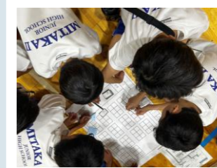
避難所運営ゲーム