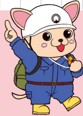
三鷹市 防災キャラクター じじよまる

地域の方が「ぼうさいの先生」として防災授業を行いました。当日は学校公開日で多くの保護者・地域の方の参観がありました。また、学びの成果を井の頭地区総合防災訓練で展示することで、家庭や地域の防災力向上にもつながりました。