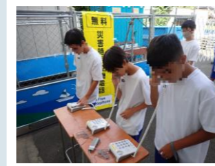
特設公衆電話の体験

三鷹市日赤奉仕団の皆さん、西部地域包括支援センターの皆さん等が講師となって様々な体験・訓練を行いました。