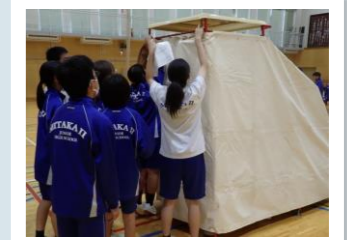
仮設トイレの組立