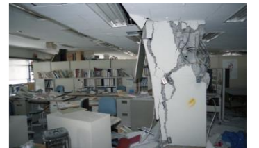
被災した神戸市役所

阪神淡路大震災や東日本大震災のように大規模広域災害時には、公助の担い手となる職員や公共施設等も被災するとともに救助等の緊急対応業務が重なるため、公助が麻痺するという事態が発生しました。