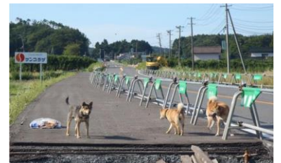
放浪状態となった犬(福島県)

いつ、どこで災害が起こっても大切なペットの命を守れるよう、日ごろから対策をしていきましょう。