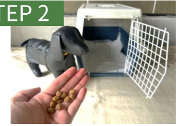
中におやつを投げ入れ、中で食べさせる。扉は締めない。