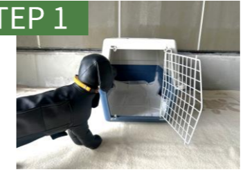
クレートのある状態に慣れさせる。無理やり入れない。