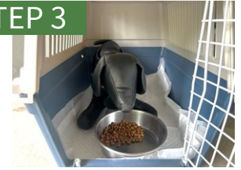
中にフードを置き、ケージの中で食べさせる。慣れてきたら短時間扉を閉める。