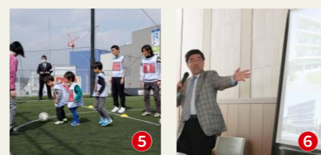
①マンションの免震構造見学会 ②非常用放送設備の放送体験 ③夜の防災訓練~ツナ缶ランブルづくり~ ④近所のスポーツジムとコラボしたエコノミー症候群を防ぐための体操教室 ⑤サッカーを通して楽しく防災を学ぶ「サッカー×防災」イベント ⑥近隣大学と連携した防災講演会