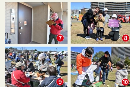
⑦【安否確認訓練】各住戸は安否確認シートを貼り出し、それを担当者が確認し情報を集約します。⑧【そなえるアクション】8つのミッションに挑戦し、防災設備の使い方等を学びます。⑨【そなえるドリルワークショップ】家族に必要な備えを考える、オリジナルの防災ツール「そなえるドリル」を使ったワークショップ。⑩【バランダーパーティー】避難の際に蹴破るバランダーパーティー。どのくらいの力が必要か、体験してもらいます。