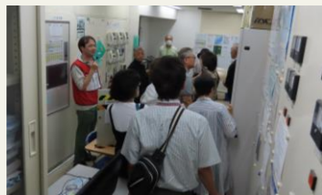
▲ 24時間有人の管理室。エレベーター等設備の管理をすともにも有事の際には各戸や共有部へ放送される仕組みもあるそうです。