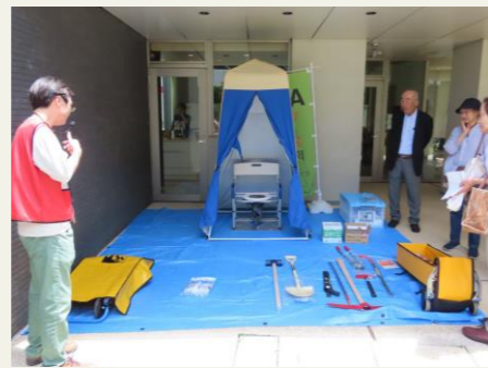
◀ 防災倉庫には階段避難車や救出工具セット、仮設トイレ等が備蓄されています。中でも、污水管のトラブルを簡易的に診断できる「污水管確認チェッカー」には会員の皆さんも興味津々でした。